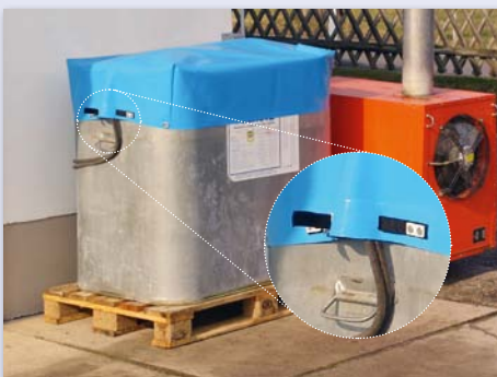
Halbhohe Haube mit Klemmschloss