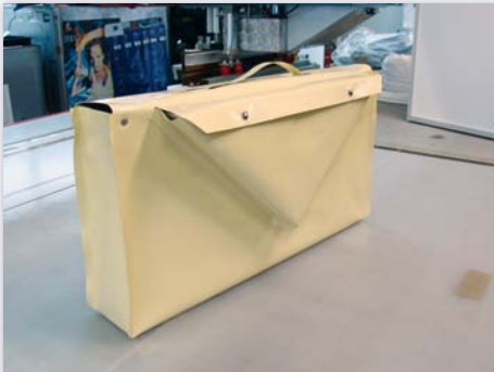
Tasche für Messeprodukte