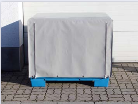
Palettenhülle mit Reißverschluss