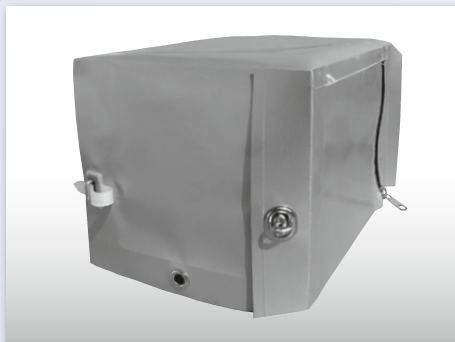
Drehverschluss + Ovalöse