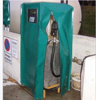
Wetterschutzhüllen für Tankstelle mit Sichtfenster und Reißverschluss