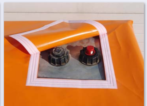
Klappe mit Klettverschluss*