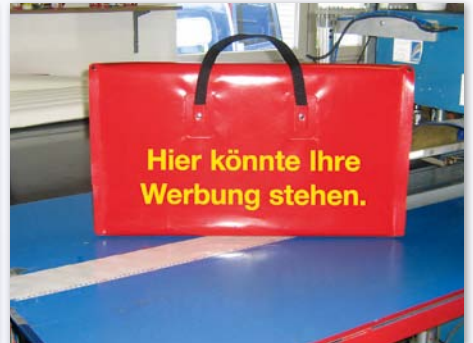
Tasche für Platten und Schilder