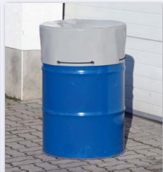
Verschluss mit Expanderseil