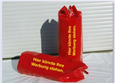
Ösen und Zugkordel